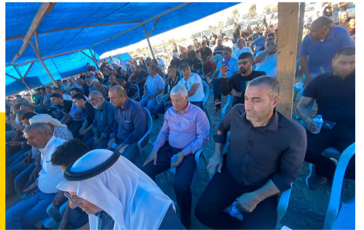
مشاركة أبناء الوفاء في مهرجان التحدي والصمود الحادي عشر في العراقيب.