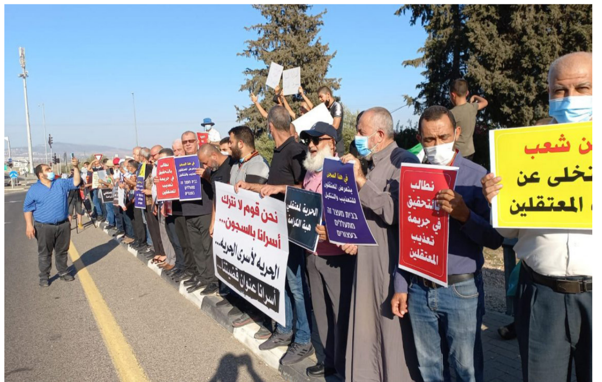
أبناء الوفاء والإصلاح يشاركون في الوقفة الإنسانية لمعتقلي هبة الكرامة التي دعت إليها لجنة الحريات المنبثقة عن لجنة المتابعة . الأحد 22-8-2021